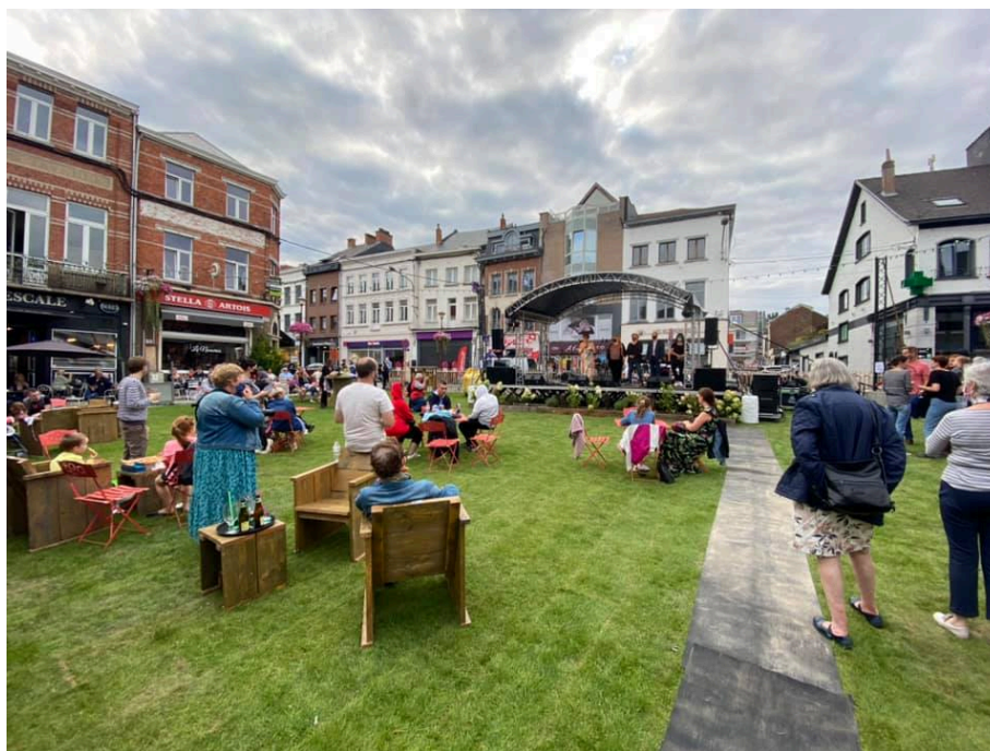
@Ville de Wavre / Wavre sur Herbe/ La Dictée pour rire 2021

La dictée sera courte, drôle et inventive .